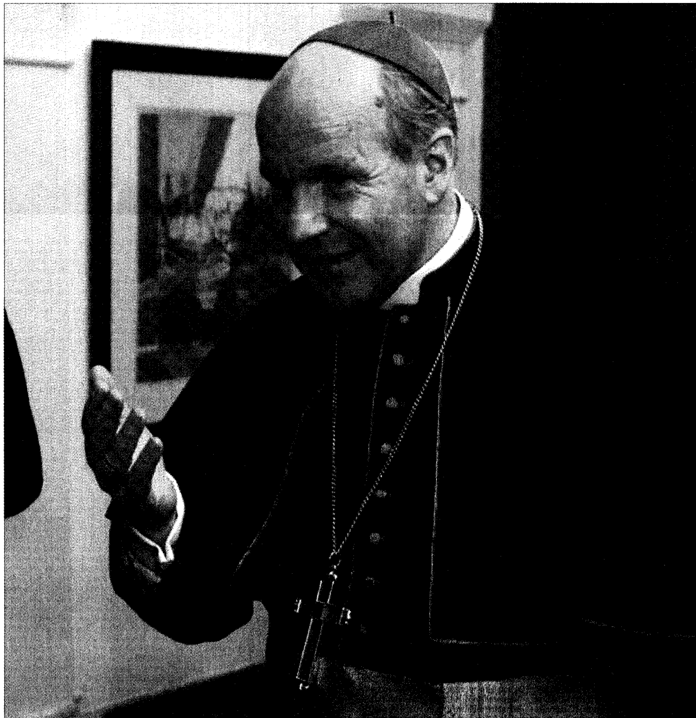
Christoph Schönborn, arcivescovo di Vienna dal 1995, è stato creato cardinale da Giovanni Paolo II nel 1998. Nello stesso anno è stato nominato presidente della Conferenza episcopale austriaca. Esperto della cristianità orientale, è membro delle Congregazioni vaticane per le chiese orientali, per la dottrina della fede e per la formazione cattolica