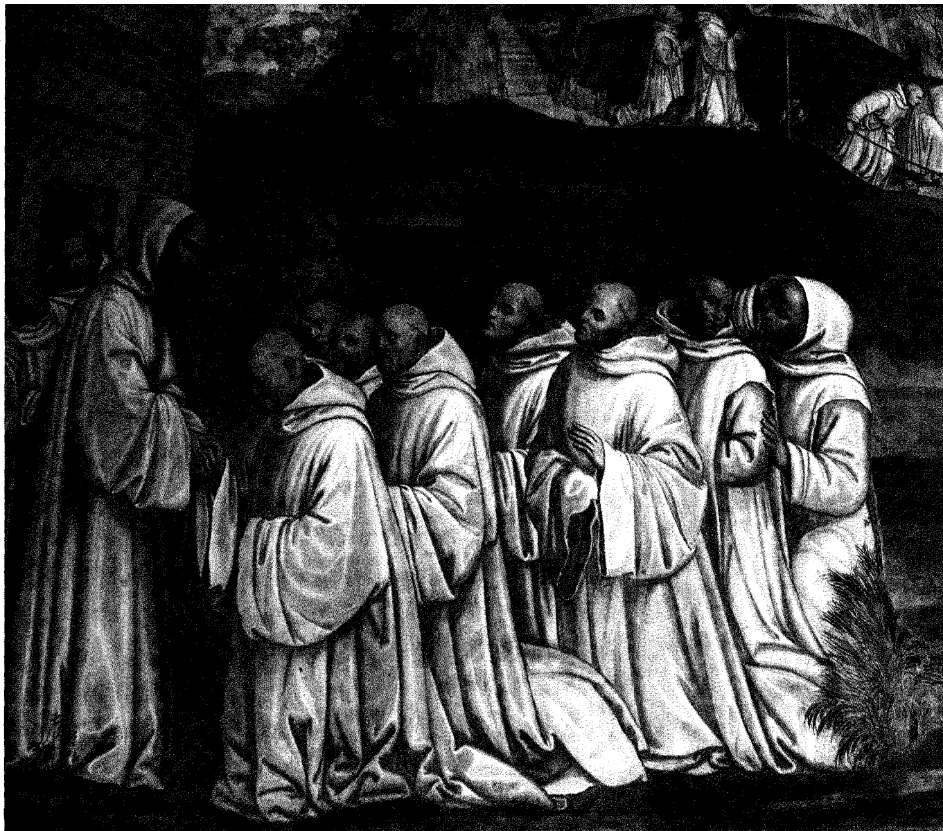
Giovanni A. Bazzi detto il Sodoma (1477-1549), "Come Benedetto pregato dai monaci produce l'acqua dalla cima di un monte", dal ciclo di affreschi dell'abbazia di Monte Oliveto Maggiore (Siena)